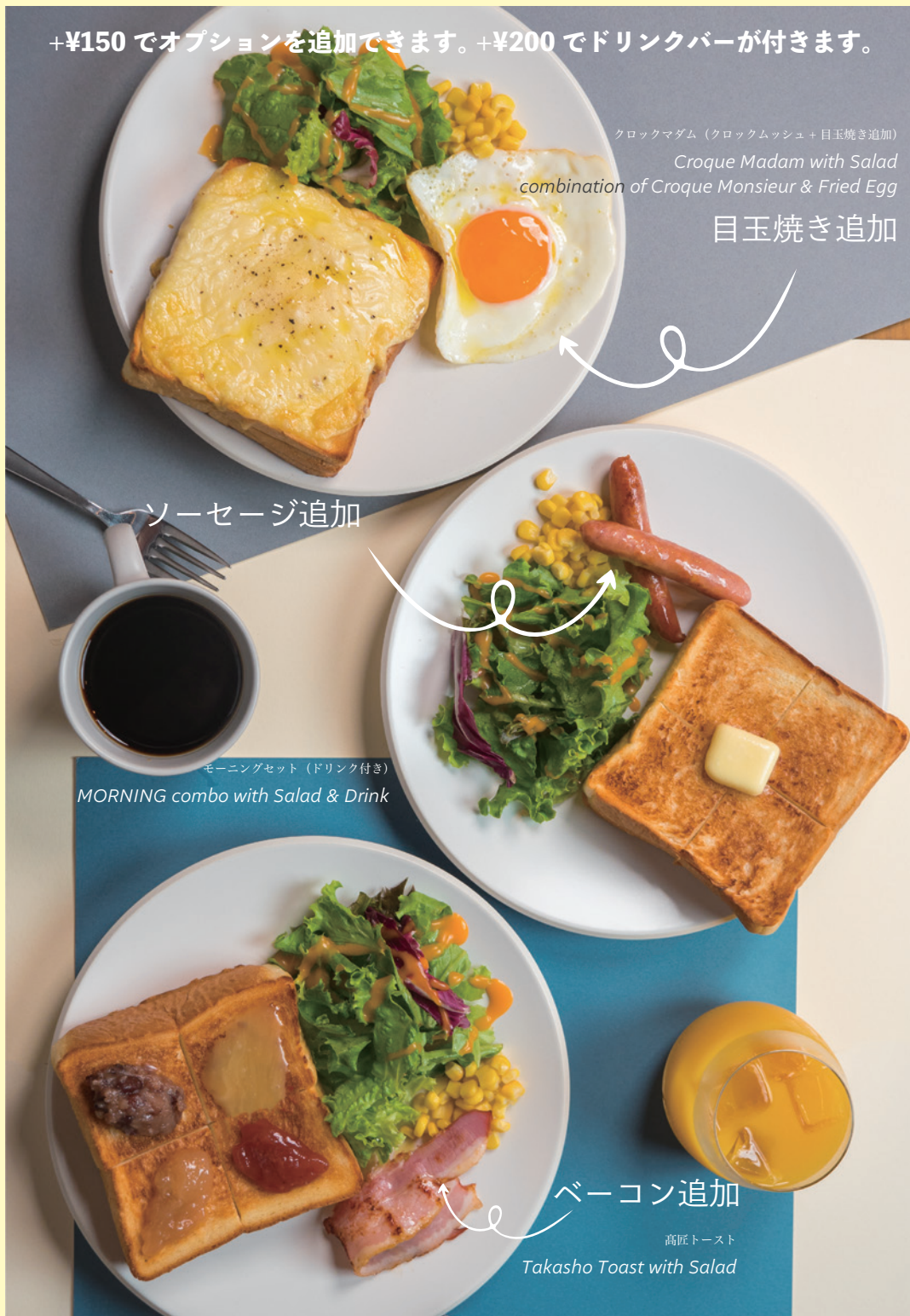
クロックマダム (クロックムッシュ+目玉焼き追加) Croque Madam with Salad combination of Croque Monsieur & Fried Egg